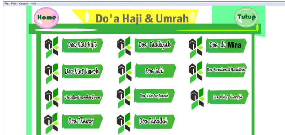
Gambar 3.4 Tampilan Menu Doa-doa Ringkas

doa yang wajib di baca ketika melaksanakan ibadah haji dan umroh. Dalam menu doa-dao ringkas ini terdapat 11 (sebelas) doa yang wajib dibaca ketika ibadah haji dan umroh berlangsung baik ibadah ketika di kota mekkah maupun dikota madinah.