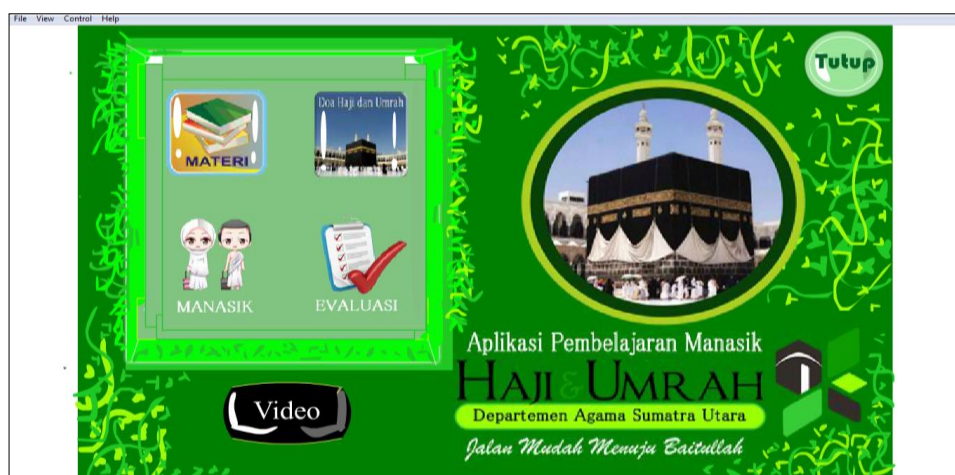
Gambar 3.1 Tampilan Menu Utama

Pada tampilan menu utama terdapat 5 (lima) menu utama dari aplikasi pembelajaran manasik haji dan umroh. Pada menu utama pengguna dapat langsung melihat isi dari 5 (lima) menu yang berisikan segala informasi tentang haji dan umroh baik pelaksanaannya maupun tatacara ibadah haji dan umroh sesuai dengan syariat islam dan pedoman agama.