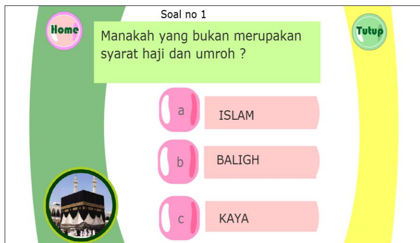
Gambar 3.9 Tampilan Evaluasi

Tampilan evaluasi merupakan tampilan pertanyaan pilihan berganda dan dapat di jawab oleh pengguna langsung, dan mengukur pemahaman pengguna tentang ibadah haji dan umroh. Dimana dalam evaluasi terdapat 10 (sepuluh) pertanyaan yang akan dijawab oleh pengguna yang nantinya jawaban yang dijawab oleh pengguna akan diberikan nilai sesuai dengan isian oleh pengguna dengan soal pilihan berganda.