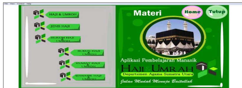
Gambar 3.2 Tampilan Menu Materi

Pada Menu Materi pengguna dapat melihat isi menu menu yang terdiri dari 6 (enam) menu yang masing-masing menu memiliki materi dan fungsi yang berbeda. Pada menu ini pengguna dapat melihat informasi umum seputar ibadah haji dan umroh yang berisikan materi dan pengertian tentang informasi umum ibadah haji dan umroh. Seperti materi tentang haji dan umroh, jenis-jenis haji, hukum haji dan umroh, rukun haji dan umroh, syariat haji dan umroh, dan pengertian manasik haji sesuai syariat islam.