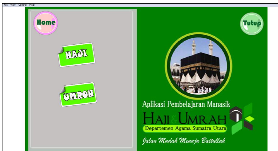
Gambar 3.5 Tampilan Menu Manasik Haji dan Umroh

Pada tampilan Manasik haji dan umroh terdapat 2 (dua) menu yaitu haji dan umroh. Dimana pada isi menu haji dan umroh pengguna dapat melihat materi tentang haji dan umroh sesuai dengan pelaksanaan ibadah haji dan umroh sesuai dengan syariat dan pedoman islam. Gambaran proses ibadah haji dan umroh dari awal sampai selesai dalam mengerjakan ibadah haji dan umroh.