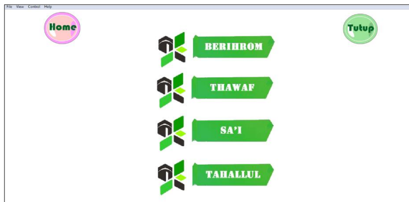
Gambar 3.7 Tampilan Isi Menu Manasik umroh

Pada tampilan ini pengguna dapat melihat rangkaian pelaksanaan ibadah umroh yang masing-masing menu terdapat informasi tentang pelaksanaan ibadah umroh.