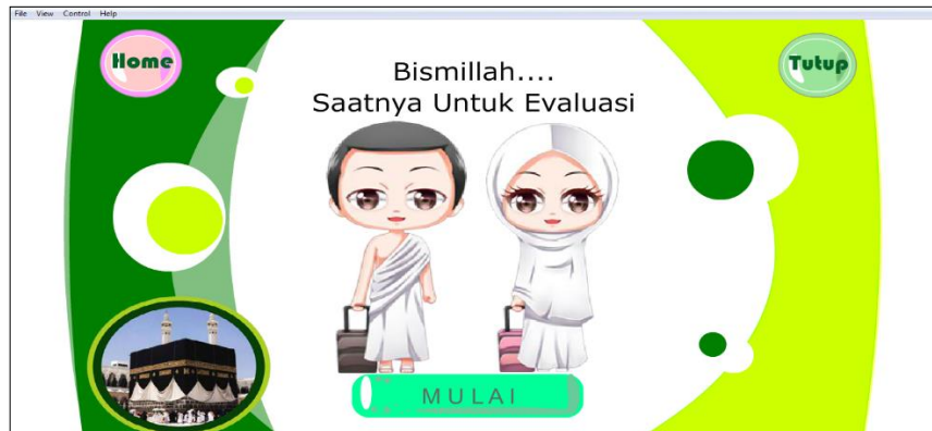
Gambar 3.8 Tampilan Menu Evaluasi