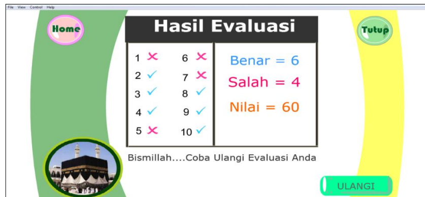
Gambar 3.10 Tampilan Hasil Evaluasi