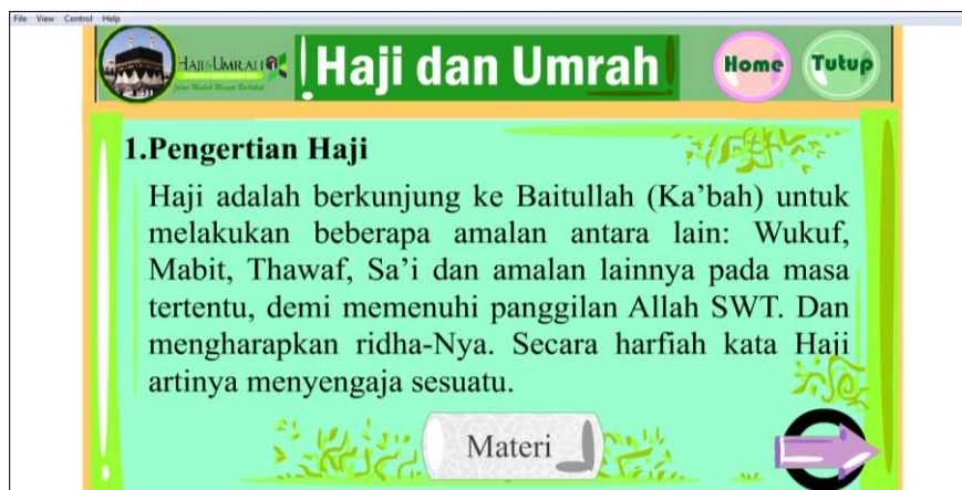
Gambar 3.3 Tampilan Isi Materi

Menu ini merupakan menu yang berisikan informasi umum atau materi umum tentang pelaksanaan ibadah haji dan umroh. Pada tampilan isi materi berisi sebuah pengertian umum sesuai dengan bahasa harfiah dan terdapat gambar yang menggambarkan suasana pada saat ibadah haji dan umroh sesuai pelaksanaan dan ketentuan syariat islam dalam menjalankan ibadah haji dan umroh.